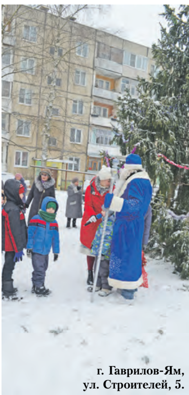
г. Гаврилов-Ям, ул. Строителей, 5.

Вот и отгремели фейерверками, отскверкали разноцветными огнями, отзвучали хороводными песнями вокруг елок новогодние праздники. Но представления, оказывается, состоялись не только в школах и детских садах района, а также в учреждениях культуры и дополнительного образования, но и прямо во дворах, на улицах, в парках, которые в прошлом году привели в порядок благодаря губернаторскому проекту "Решаем вместе". Вот и получается: вместе решили, вместе благоустроили места отдыха и вместе это дело отметили - что может быть лучше?