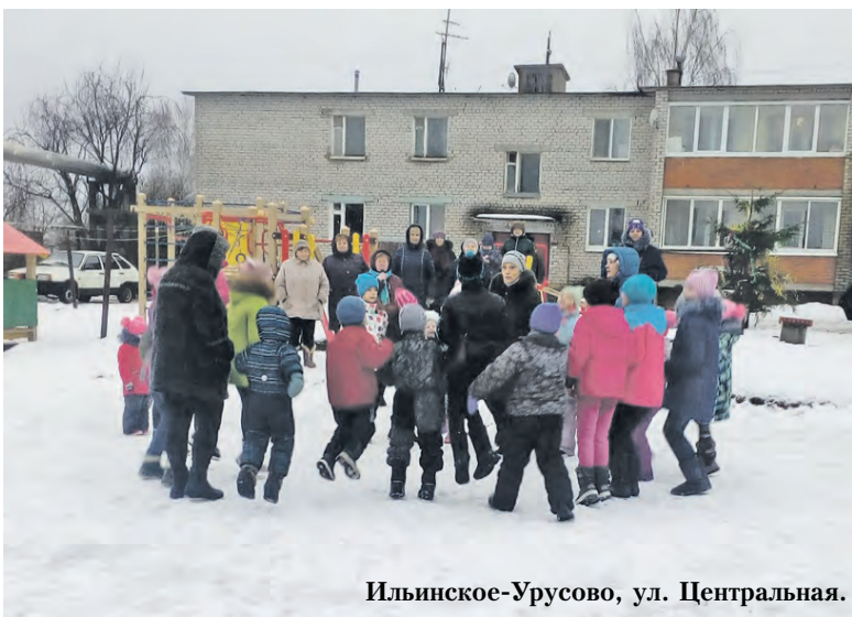
Ильинское-Урусово, ул. Центральная.

Великосельская школа, с. Великое, ул. Некрасовская, д. 1.